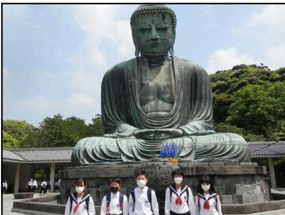
「高德院 大仏前」2年生鎌倉学習より