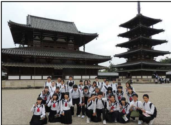
「法隆寺」3年生修学旅行より

コロナ禍、安全で充実した活動が実施できたのは、保護者の皆様のご支援ご協力があったからこそと感謝しております。本当にありがとうございました。