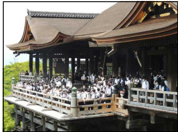
「清水寺」3年生修学旅行より