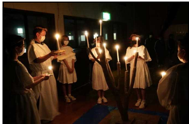
「キャンドルファイヤー」1年生自然教室より