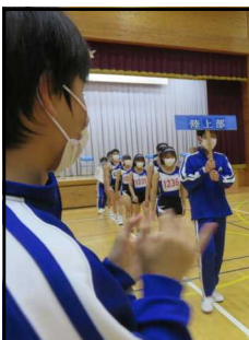
5月24日(火)陸上部激励会の様子から

※6月23日(木)~7月8日(金)は、5時間目なしで部活動を行い16:20下校です。 月曜日にも部活を実施します。水曜日は部活がありません。